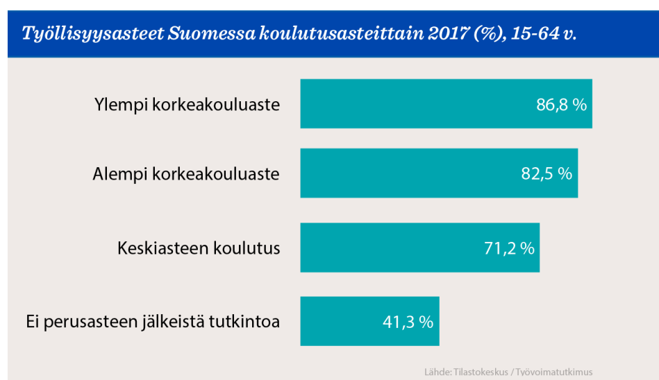
Kuvio: Työllisyysasteet koulutusaloitin

Olemme erityisen huolissaan toisen asteen koulutusta vailla olevien työllisyydestä.